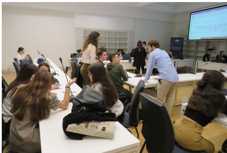
Ateliers avec les élèves espagnols