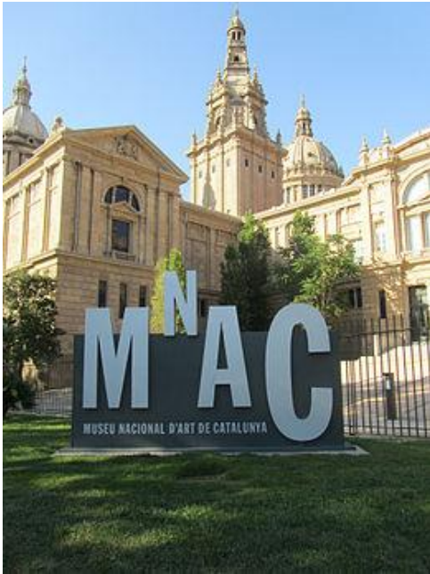
Visite du Museo Nacional de Arte de Cataluña (MNAC)