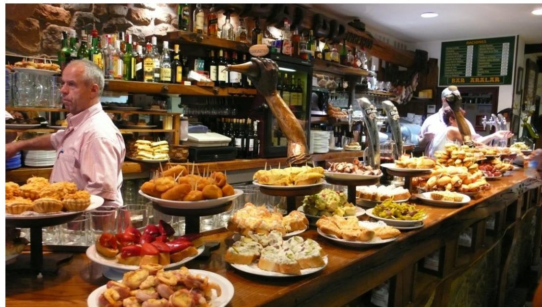
Déjeuner offert par l'école