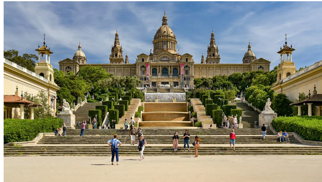
Promenade dans le parc de Montjuïc