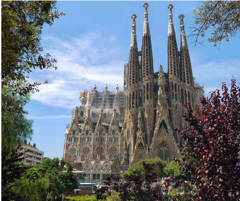
Visite de la Basilique de la Sagrada Familia