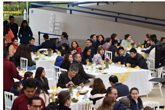
Petit-déjeuner de bienvenue