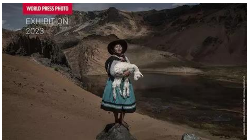
Exposition du World Press Photo