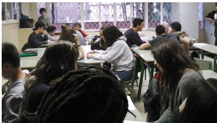
Cours et ateliers au lycée Barres i Ones