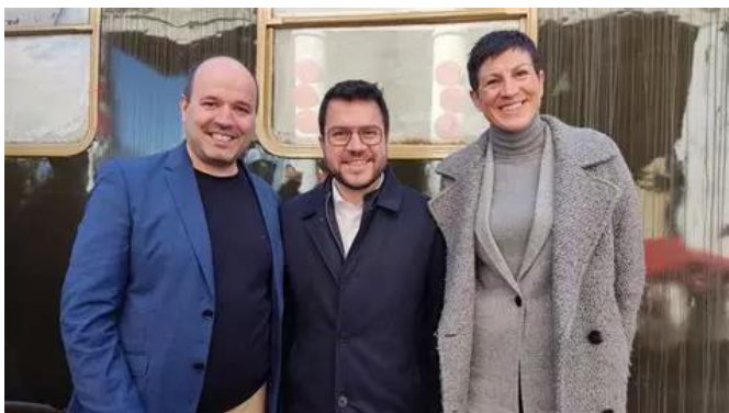
Accueil par le Directeur du lycée