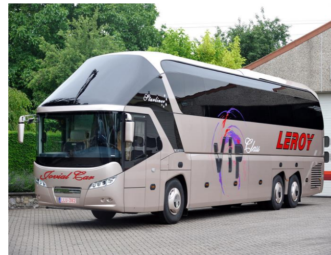
21 h Départ en car de Badalona