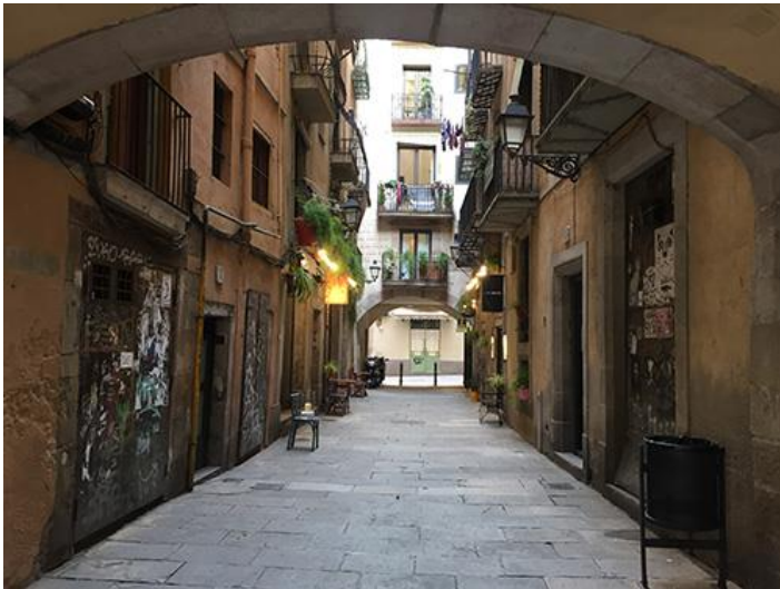
Visite du quartier Borne