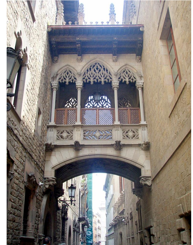
“Chasse au trésor” dans le quartier Barrio Gótico