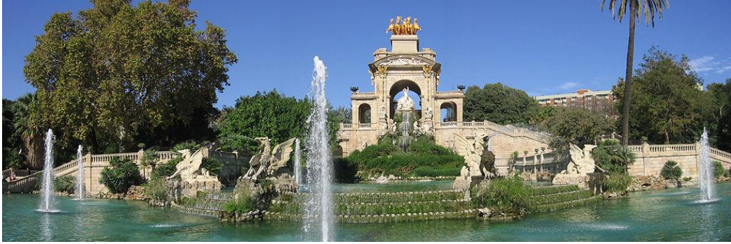
visite du parc de la Ciudadela