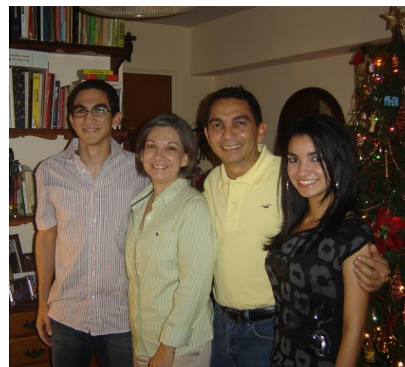
Après-midi en famille