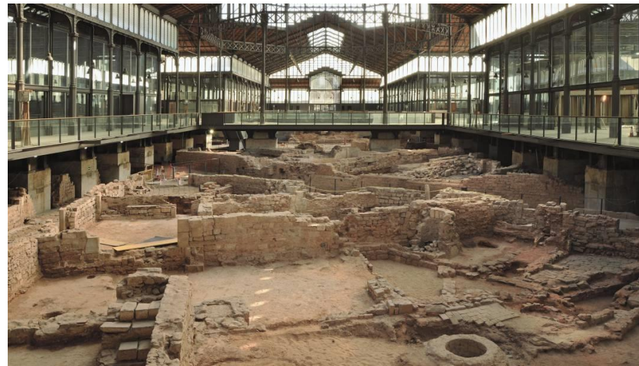
Visite site archéologique et marché du quartier Borne