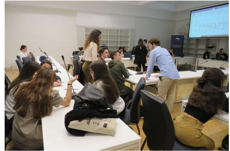
Ateliers avec les élèves espagnols