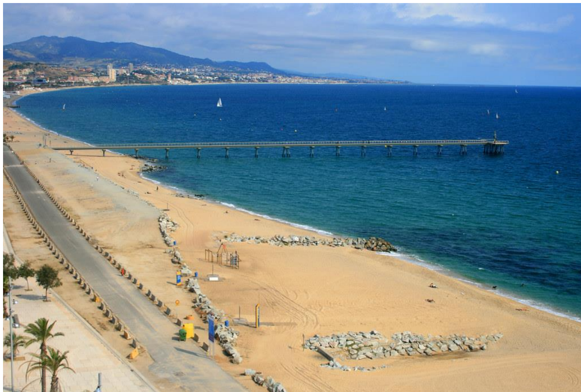
Journée en famille